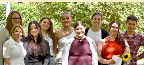
Die erfolgreichen Lernenden der Heime Kriens.