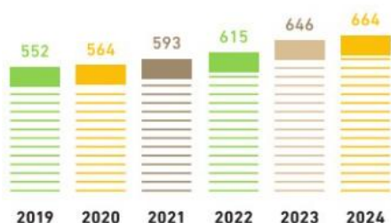
Entwicklung Kunden im Schnitt pro Monat